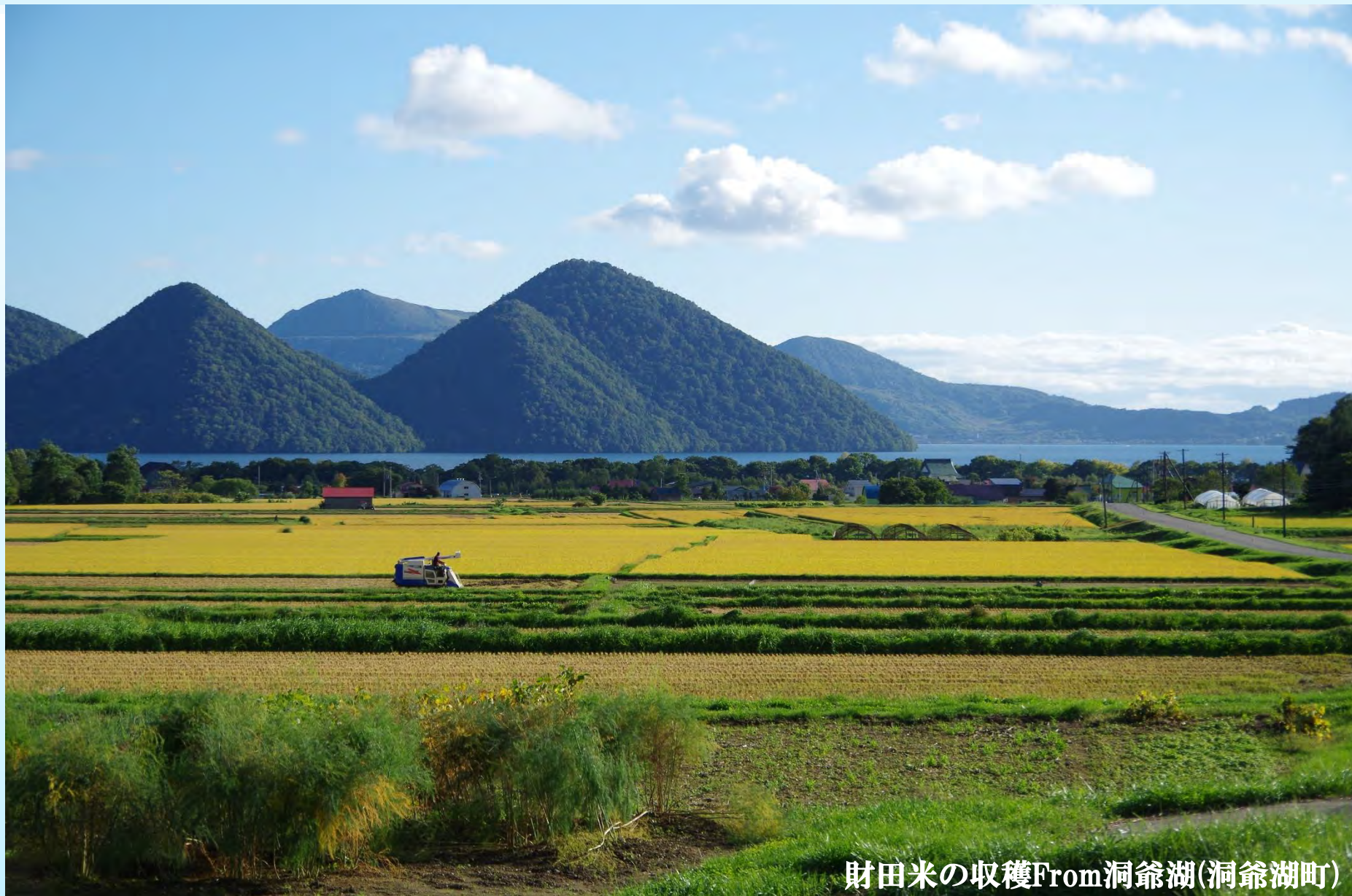
財田米の収穫From洞爺湖(洞爺湖町)