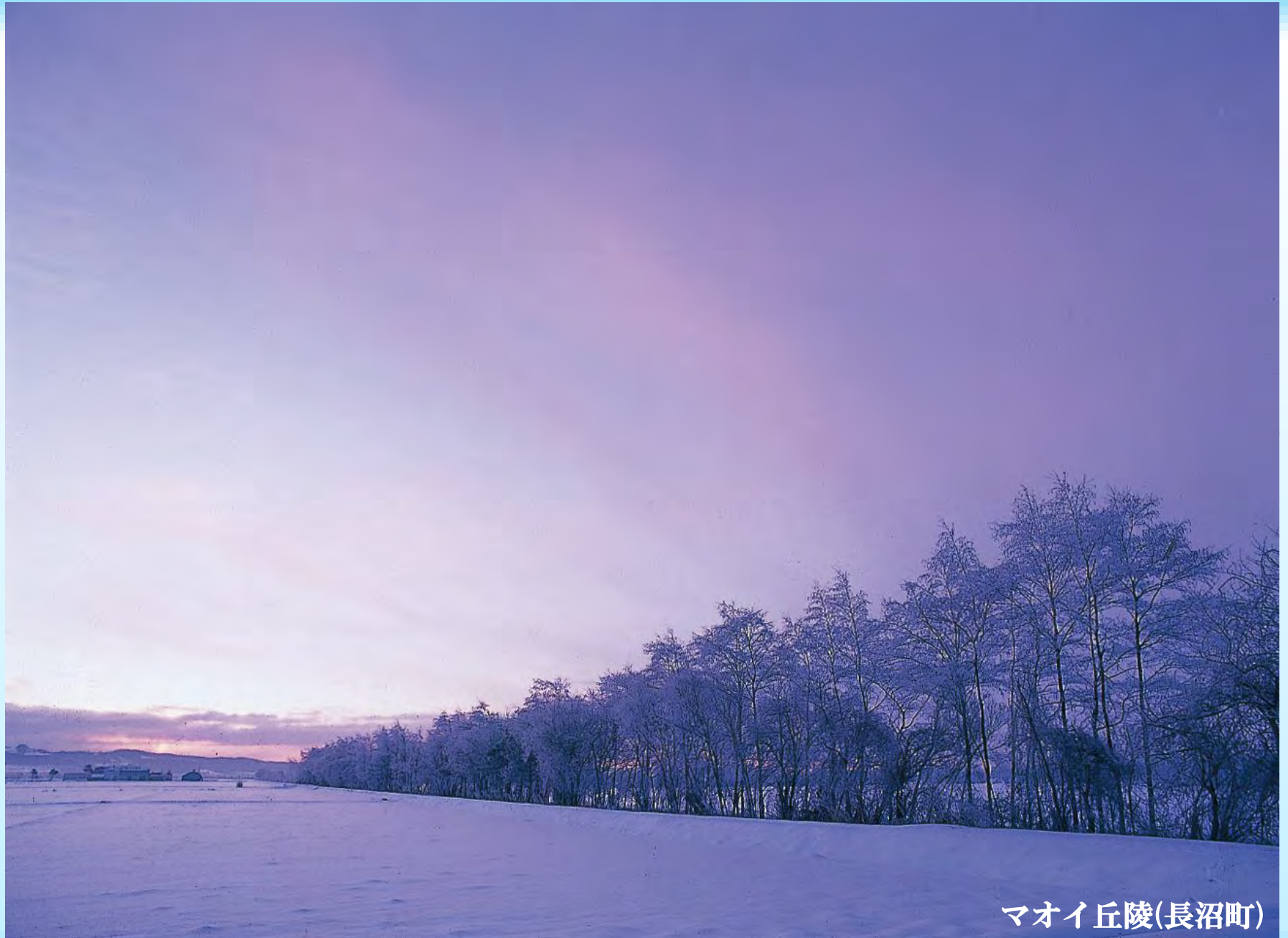
マオイ丘陵(長沼町)