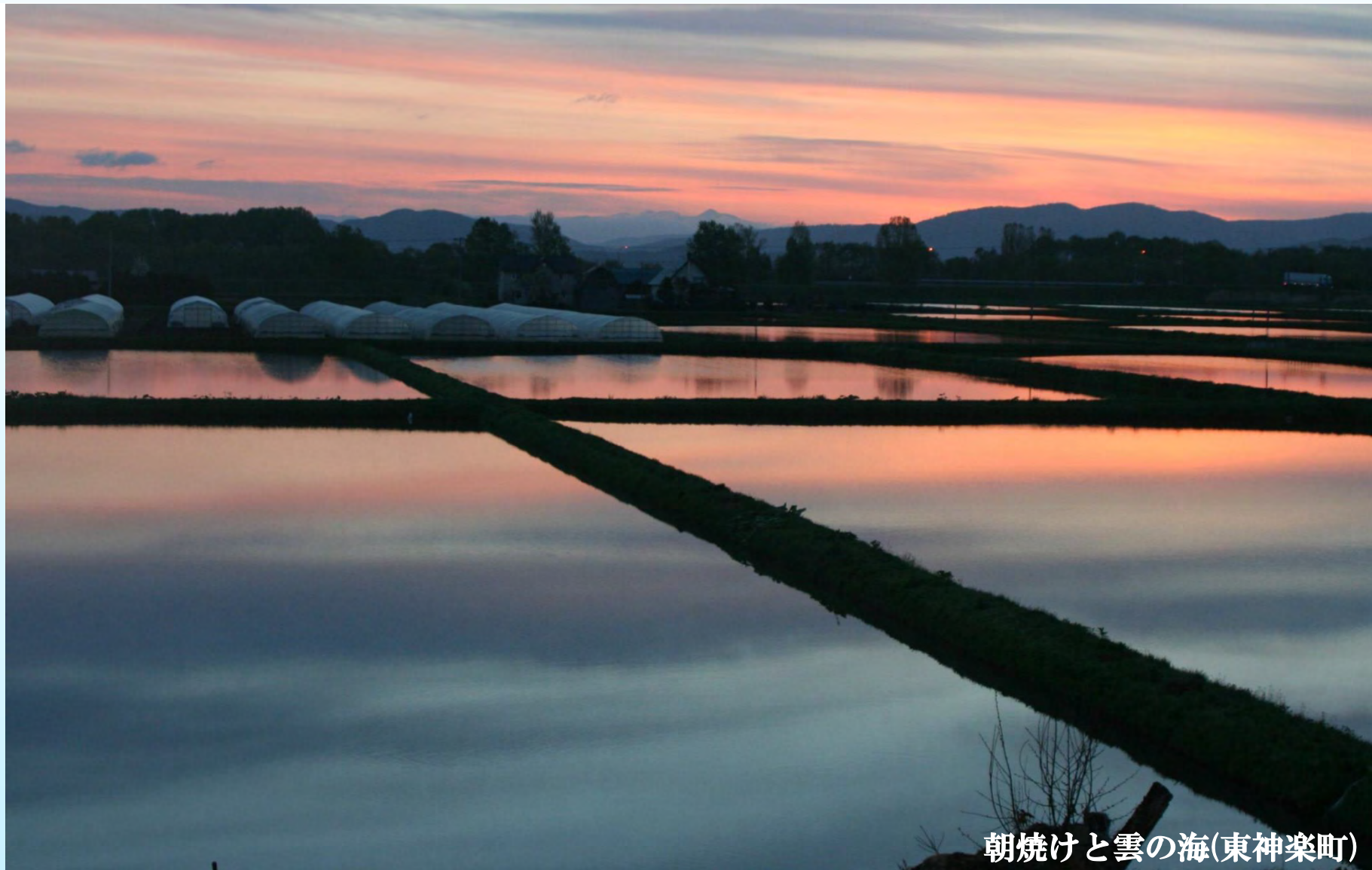
朝焼けと雲の海(東神楽町)