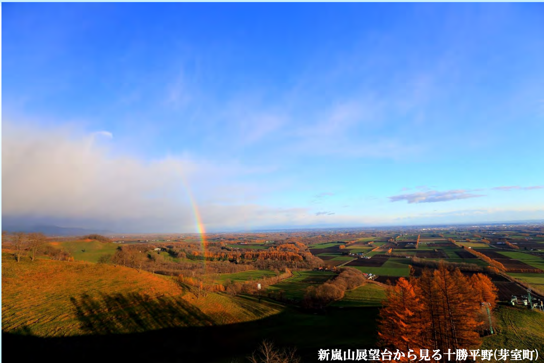
新嵐山展望台から見る十勝平野(芽室町)