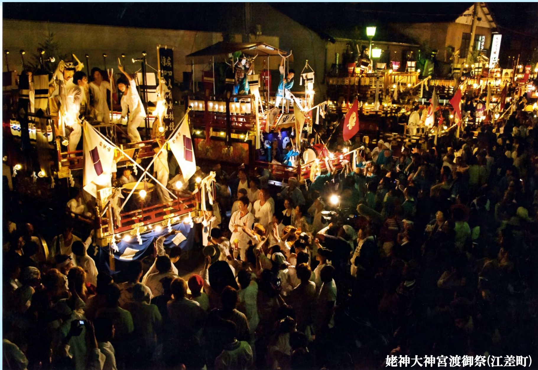
姥神大神宮渡御祭(江差町)