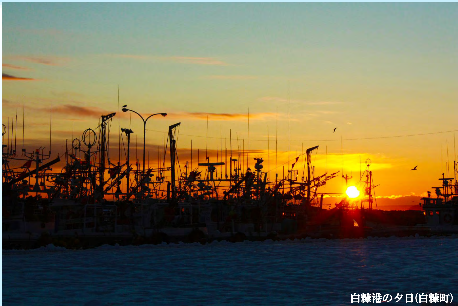
白糠港の夕日(白糠町)