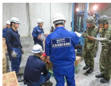
仕分け作業打合せ