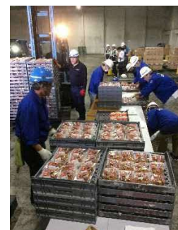
支援物資確認・詰替え作業