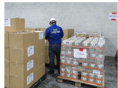
到着支援物資の確認