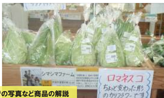
農園名、生産者の写真など商品の解説