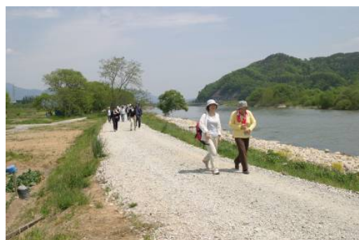
管理用道路をフットパスとして活用（最上川）

ハード支援： 治水上及び河川利用上の安全・安心に係る河川管理施設の整備を通じ、まちづくりと一体となった水辺整備を支援。