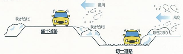
盛土道路と切土道路での吹きだまりの様子

道路には、まわりの土地よりも高い「盛土道路」と、低い「切土道路」があります。一般に、「盛土道路」に比べて「切土道路」では、吹きだまりが発生しやすい傾向にあります。