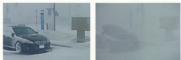
暴風雪で一瞬にして数メートル先が見えなくなる(右) 稚内市内(平成24年4月4日)

吹きだまりに注意し、無理のない運転を心がけましょう。20cm 吹きだまりによる車の発進限界