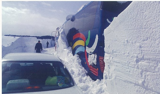
吹きだまりで立往生したバス 北見市常呂町(平成25年3月3日)

風は強いが晴れていると思ったら、雪を伴って一瞬で暴風雪に変わることもあるので、天気の変化には十分注意が必要です。