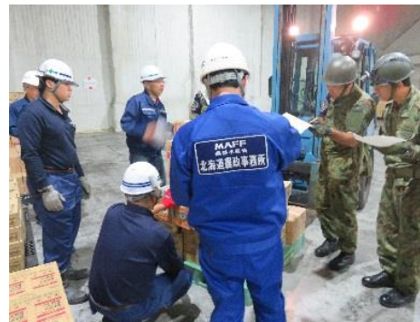
仕分け作業打合せ