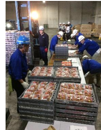
支援物資確認・詰替え作業