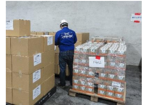
到着支援物資の確認