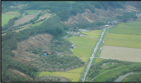
③ 道警ヘリコプターによる情報収集・映像配信