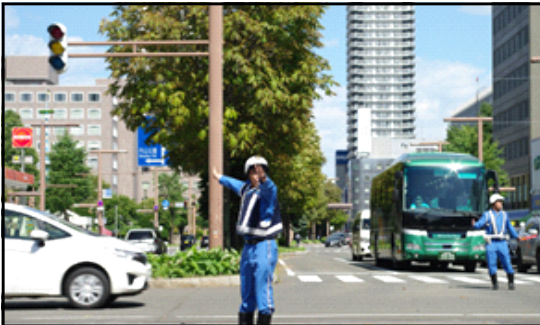
⑤ 信号機滅灯に伴う交通整理