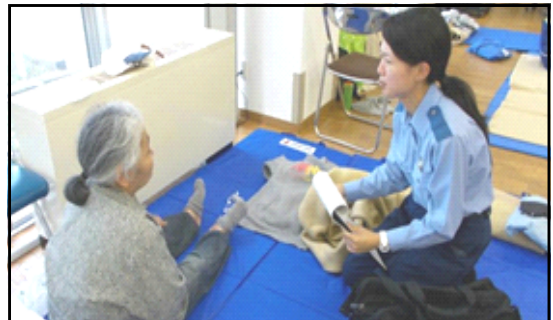
⑥ 「はまなす隊」による避難所巡回