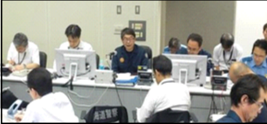
① 北海道警察災害警備本部（道警本部）