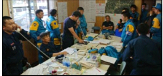
② 現地警備本部（厚真町）