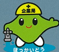
ほっかいどう企業局

降雨などによる河川の水質の変化に迅速に対応し、一定の水質を維持することができます。