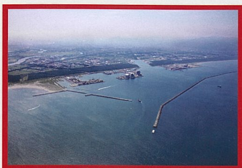
石狩湾新港地域工業用水道