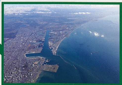
苫小牧地区工業用水道