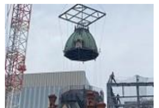
八角塔屋根の移設 (令和4年8月)