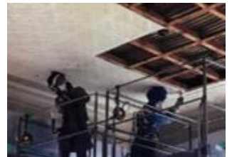
メタルシーリングの取り外し