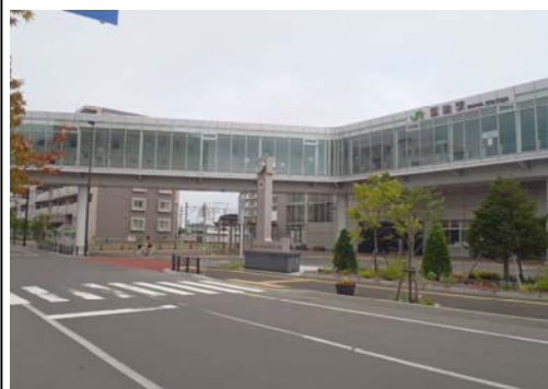
恵庭駅と再開発ビルを結ぶ空中歩廊「ペDESTリアンデッキ」