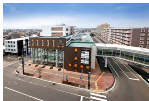
恵庭駅と直結し、有料老人ホーム、保育園、商業テナント、医療モール、行政関連スペース、屋内自転車駐車場の多機能が集約された再開発ビル「いざりえ」

恵庭駅西口の再整備と近隣の緑の語らいの広場が核となり人が集まるようになれば、線として繋がりが、その波及効果により面に広がることで、西口地域全体が活性化していくことを期待しています。