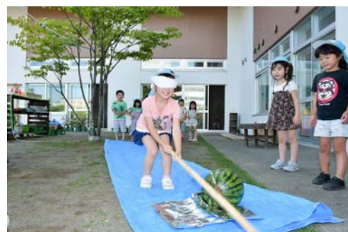
再開発ビル内に移転した「こすもす保育園」