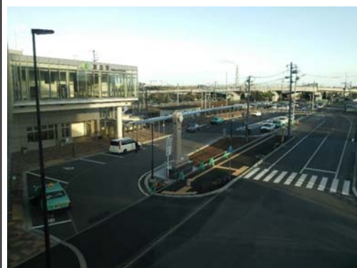
拡張し歩行支援施設が整備され、交通結節点機能が向上した「恵庭駅前(西口)広場」