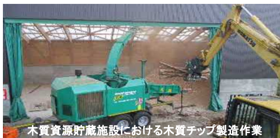
木質資源貯蔵施設における木質チップ製造作業