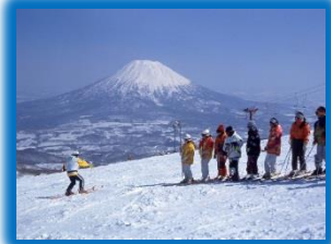
アジア随一の ウィンター・リゾート