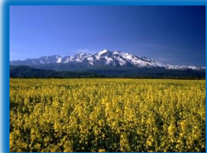
明瞭な四季と 美しく雄大な自然