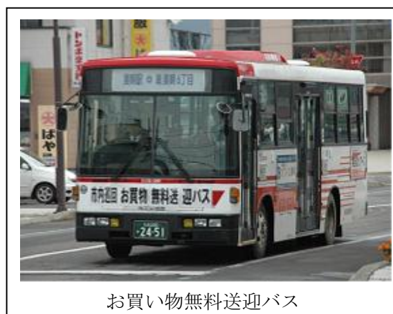
お買い物無料送迎バス

今後とも、買い物弱者対策の継続的な事業展開を図る上で、収益を上げる手段を何に求めていくかを検討していくとともに、住民からのニーズが多い宅配事業についても、行政や商工団体と連携しながら引き続き検討していくこととしています。