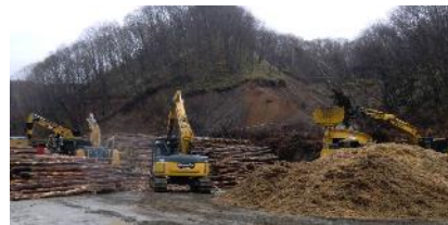
有効利用される被害木の集積状況（厚真町 幌内川流域）