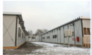
福祉仮設住宅(厚真町)