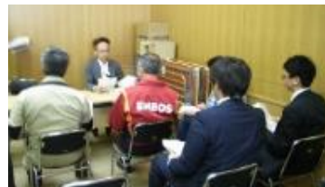
支援施策説明会・移動相談会(安平町)