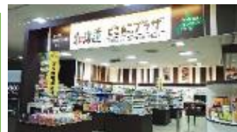
北海道どさんこプラザ・道産品フェア