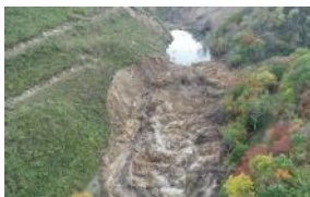
林道の復旧（厚真町 幌内宇隆線）