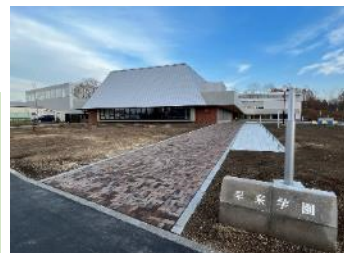
早来学園校舎(安平町)