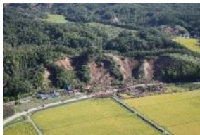
山地災害復旧事業（厚真町 東和地区）

引き続き、被災森林の一日も早い復旧を図るため、箇所ごとの具体的な復旧手法や路網整備箇所などを明らかにした「胆振東部地震森林再生実施計画」（R4. 3策定）に基づき、森林整備が必要な箇所への作業道等の早期整備や植林等の実証試験の成果等を活用した森林の造成や治山対策などの取組を推進