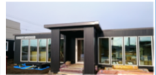
鶴川高校生徒寮(寄宿舎型)