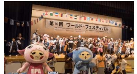
ワールドフェスティバル in 石狩

また、HIECCが開催している「世界の料理教室」について引き続き支援を行うとともに、海外からの研修生等と地域住民との交流活動を行っている独立行政法人国際協力機構（JICA）との連携を図る。