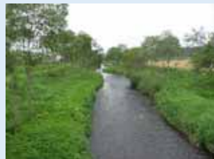
多自然川づくりに取り組んでいる藻琴川