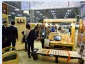
「WOODコレク ション モクコレ 2018」