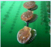
ICT技術を活用した ホタテガイの養殖