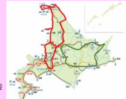
広域観光周遊 ルートの形成