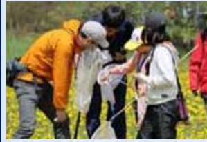
セイヨウオオマルハナバチの駆除会