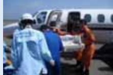
メディカルウイングによる搬送→