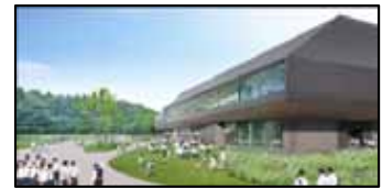
国立アイヌ民族博物館(完成予想図)