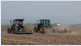
協調型トラクター (有人・無人)