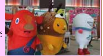
北海道観光 プロモーション