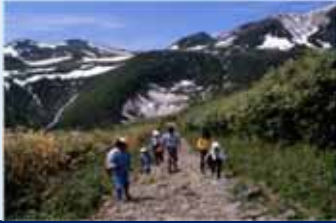
高山植物や独特の景色を楽しむ登山