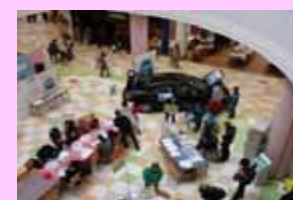
水素・燃料電池普及キャラバン