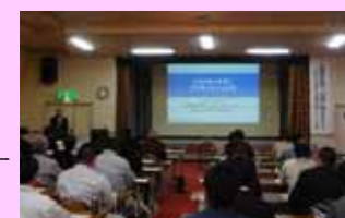
適応セミナーの開催