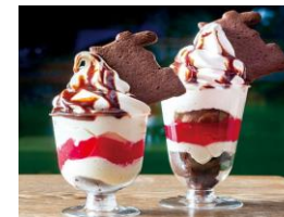
十勝パルフェ(右)680円 十勝パルフェミニ480円