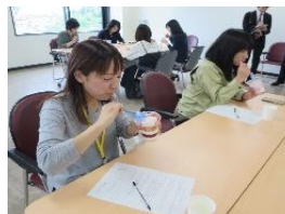
※女性職員8名による試食