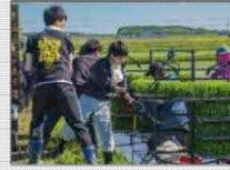
援農ボランティアの取組