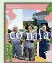
農業・農村の魅力を発信する情報誌「confa(コンファ)」