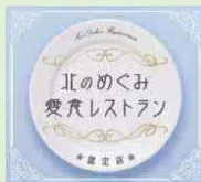
道産食材を使用したこだわり料理を提供する飲食店などを認定