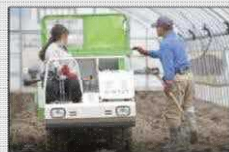
女性単独就農予定の研修生