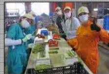
外国人材など多様な人材の確保