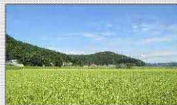
共同利用組合設立による作業の共同化