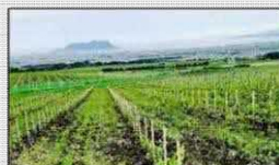
醸造用ぶどうの栽培