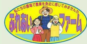
都市住民との交流活動に意欲的な農業者を登録