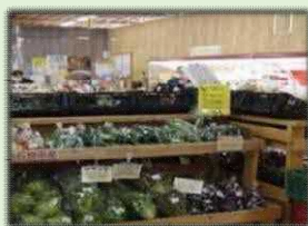
地域住民と農業者との交流拠点となる直売所