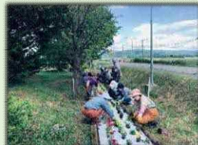
多面的機能を支える共同活動