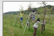
都市部からの教育旅行の受入