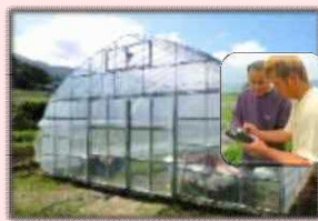
スマート農業技術の導入によるハウス施設の環境制御