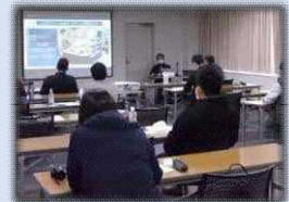
6次産業化に取り組む人材の育成