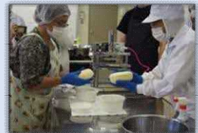
工房チーズの品質向上に向けた地域講習会