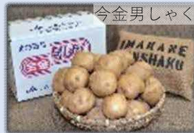
地理的表示(GI)保護制度登録産品