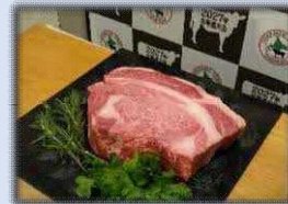
全国共進会に向けてブランド力を磨く北海道和牛