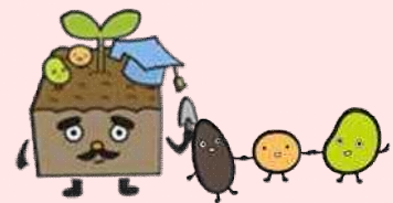
北海道クリーン農業イメージキャラクター「ハタケダ博士&クリーんだね」