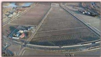
基盤整備事業によるほ場の大区画化