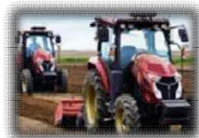
ロボットトラクター