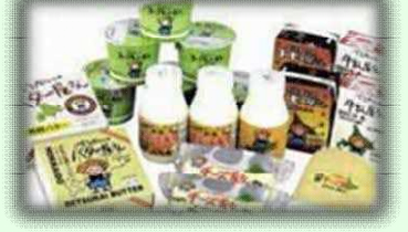
「ミルク王国べつかい」の牛乳・乳製品 (横べつかい乳業興社(別海町))