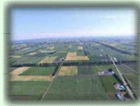
広大な農村景観(上士幌町)