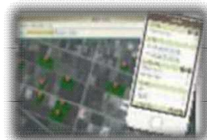
生産・経営管理システム