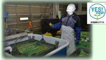
水稻の温湯種子消毒作業