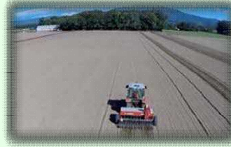
大規模畑作経営の作業(斜里町)