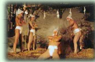
寒中みそぎ祭り(木古内町)