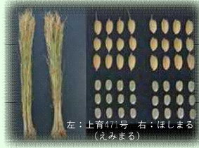
左：上育47号 右：ほしまる (えみまる)