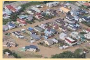
2016年 8~9月 ←大雨等

低気圧前線や台風による浸水被害、 竜巻による人的被害、建物の破損が 全道各地で発生