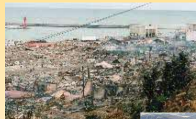
←1993年 北海道 南西沖 地震

太平洋沖(根室沖)海溝型地震 M7.8~8.5クラス 30年以内 80%程度 日本海沿岸の津波浸水想定 ・津波高10m以上 21市町村