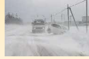
2013年 道東 ←暴風雪