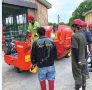
自走給餌器の操作方法習得