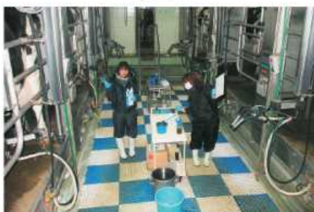
ミルクングパーラー