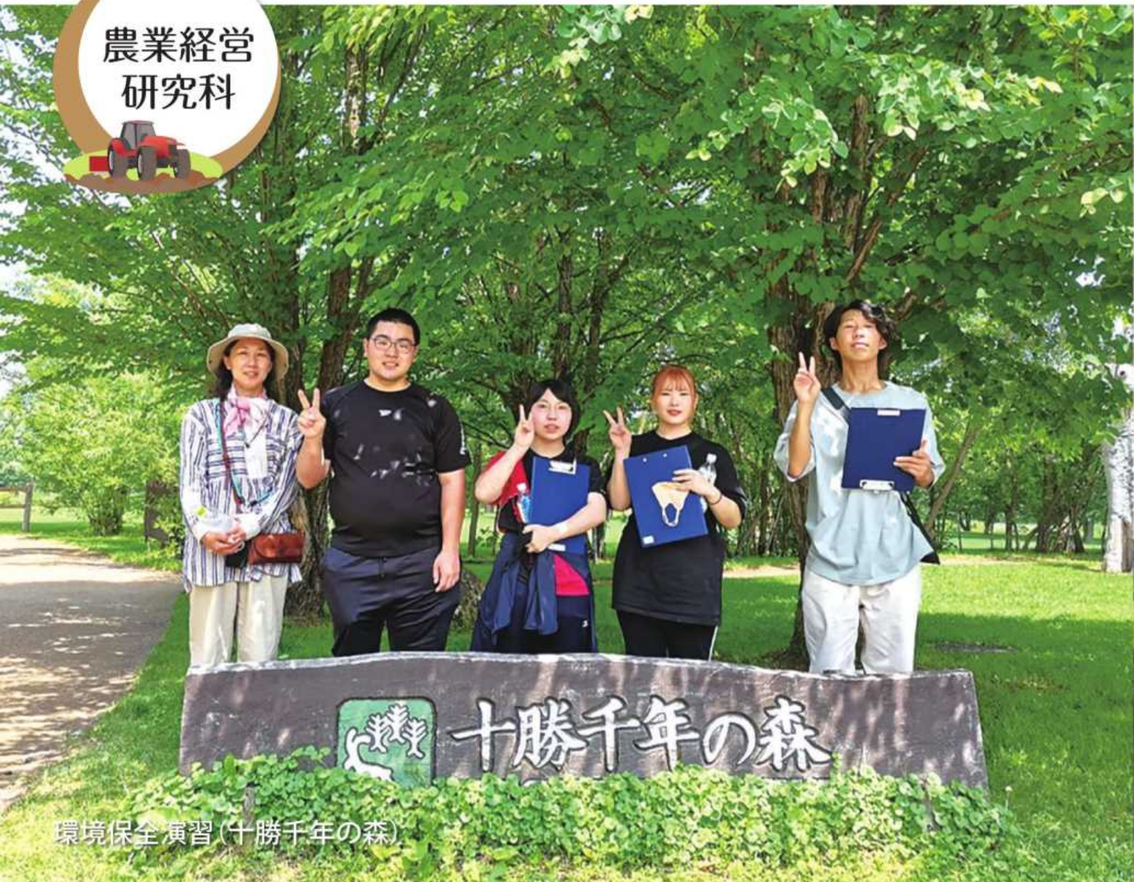
環境保全演習(十勝千年の森)