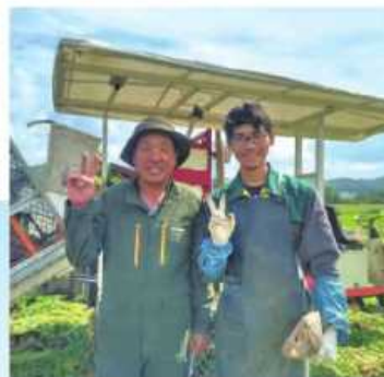
先進農家体験学習