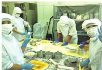
6次産業化実践実習