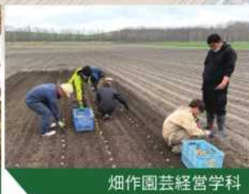
畑作園芸経営学科