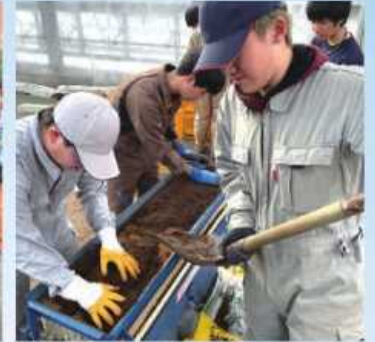
移植てん菜の苗作り

農業大学のカリキュラムは、教養科目や専門科目の授業・実習を通して、農場、牛舎で農業経営者に必要な実践する力を養います。各自の課題に基づいたプロジェクトに自ら取り組むことにより、社会の変化に対応できる経営する力を養います。