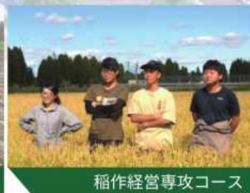
稲作経営専攻コース