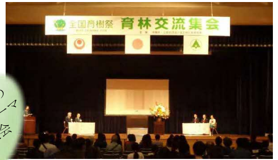
沖縄県[令和元年]での様子