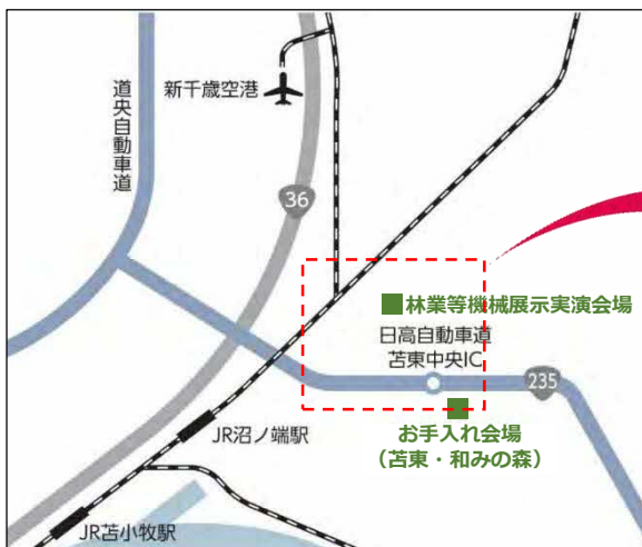
森林・林業・環境機械展示実演会 位置図-1