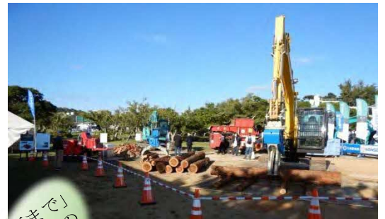
沖縄県[令和元年]での様子