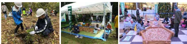
圏域木育フェスタの様子