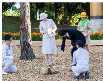
沖縄県[令和元年]での様子(施肥)