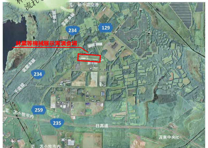
森林・林業・環境機械展示実演会 位置図-2