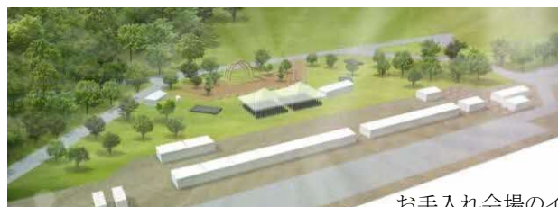
お手入れ会場のイメージ