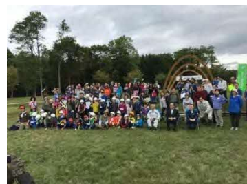
苫東・和みの森 イベント開催時の様子[平成29年]