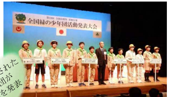
沖縄県[令和元年]での様子