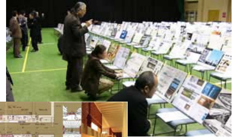
複合駅舎の設計コンペに376点の応募。