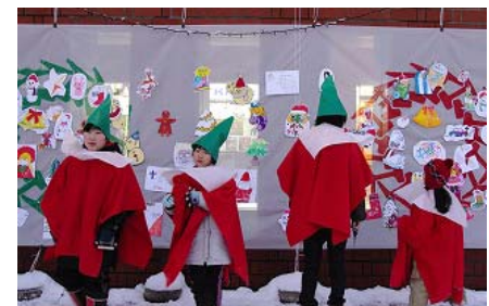
プレオープンイベント