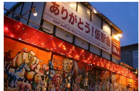
ありがとう!仮駅舎(アートイベント)

約1,500人の来場。二次審査(プレゼン、ヒアリング)の一般公開で約150人の来場。