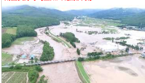
南富良野町【空知川堤防決壊】