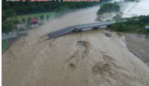
目高町【国道274千呂露橋落橋】