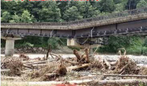
上川町【国道273高原大橋沈下】